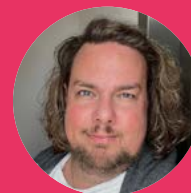
Harm Regisseur huurbetaling